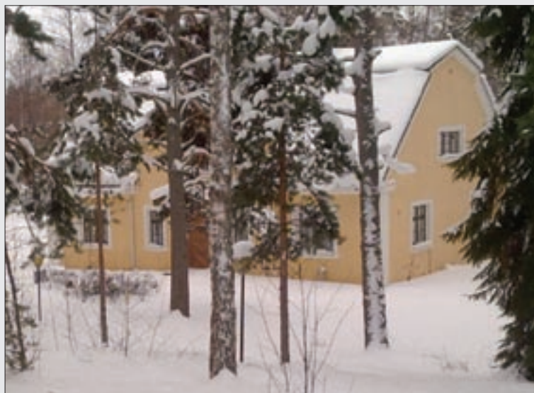
Niittylahti uinuu vielä talviuntaan.

T alvea on jäljellä vielä ainakin kuukauden verran. Kovia pakkasia ja lumipyryjä on vielä odotettavissa. Kuusanniemi-Voikkaa osaston 85 Niittylahti uinuu vielä talviunta. Tarkastuskäyntejä kesäpaikalle on talven aikana tehty säännöllisesti ja niitä jatketaan, kunnes kevät koittaa. Niittylahden piha-alueetta ei ole tänä talvena käytetty mönkijäratana, kuten edellisinä vuosina. Hyvä niin. Kesää pukkaa joka tapauksessa jo vähän ajan päästä. Haluan vielä muistuttaa osaston 85 jäseniä siitä, että meillä kaikilla on oikeus käyttää Niittylahtea. Entiset voikkaalaiset ja muut jäsenet voivat tehdä varauksia samoin säännöin.