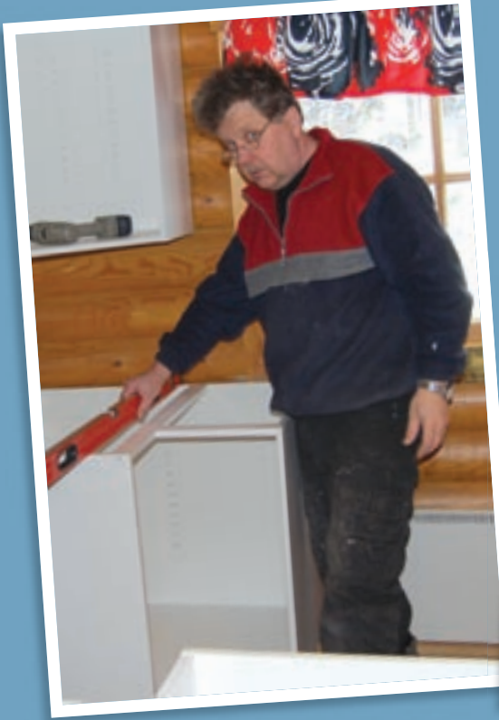
Keittosyvennyksen kalusteet ovat vaaterissa.